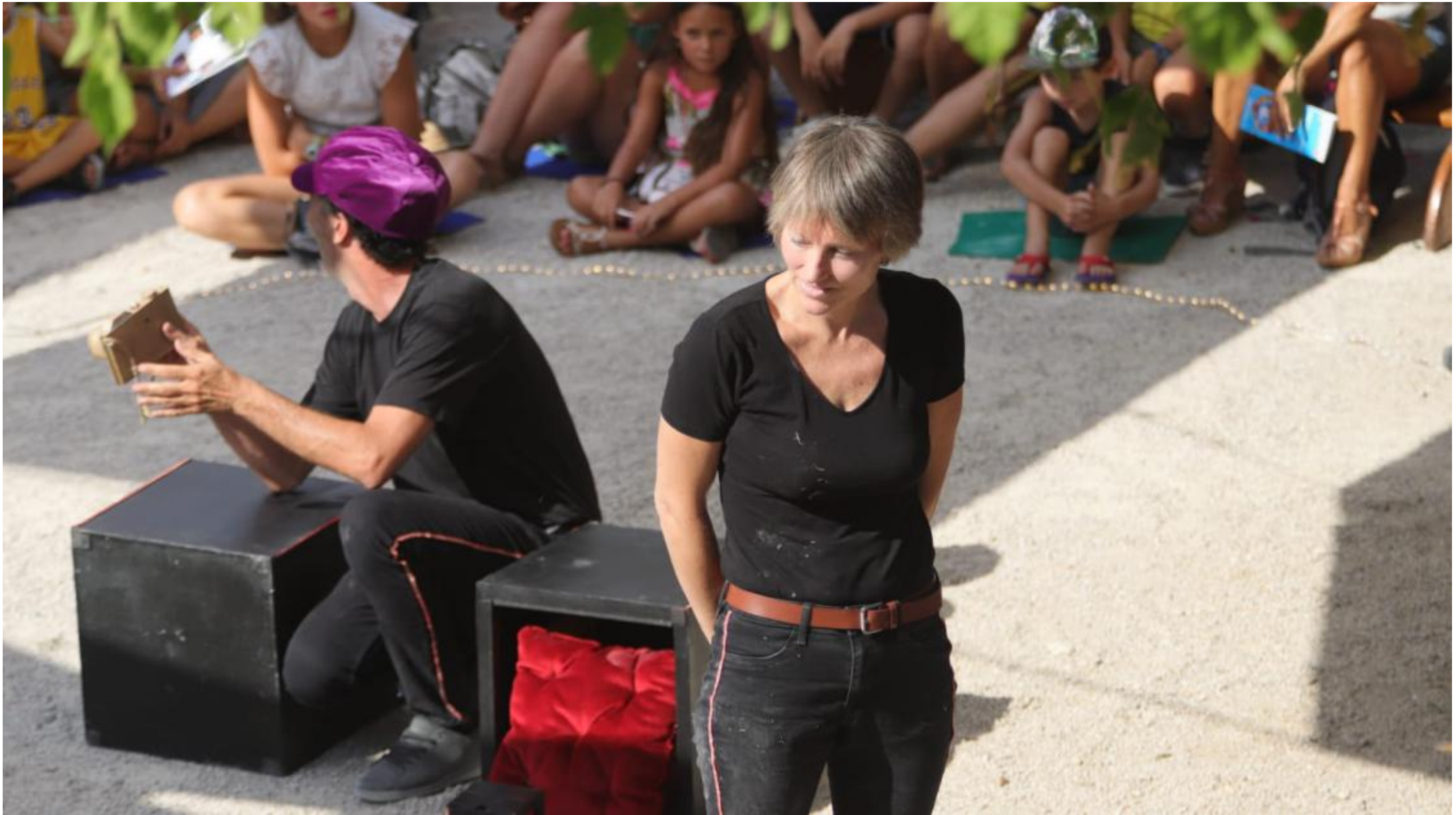
Festival Fontarts Août 2022 . Crédit photos: Mathieu Bénito