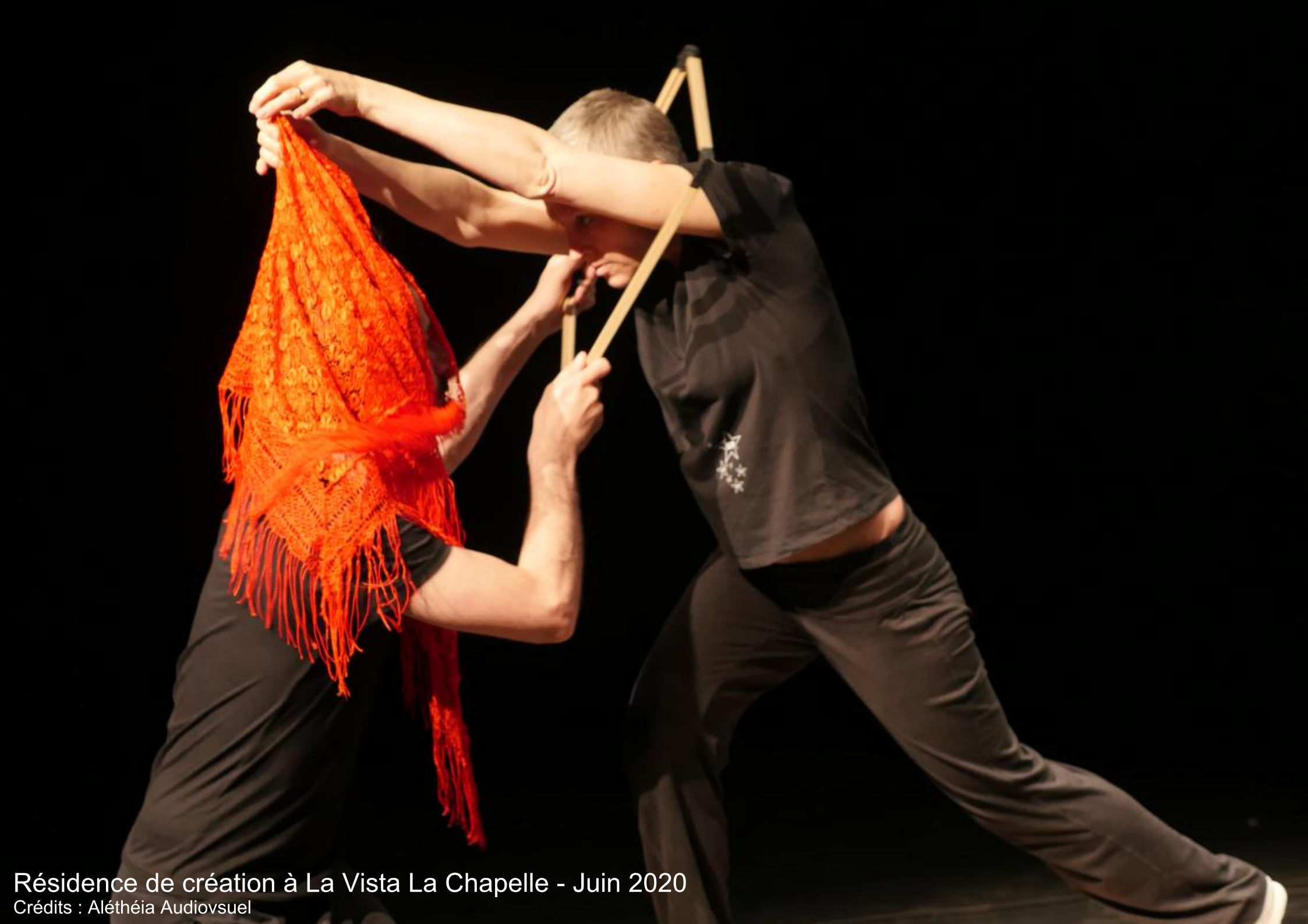
Résidence de création à La Vista La Chapelle - Juin 2020