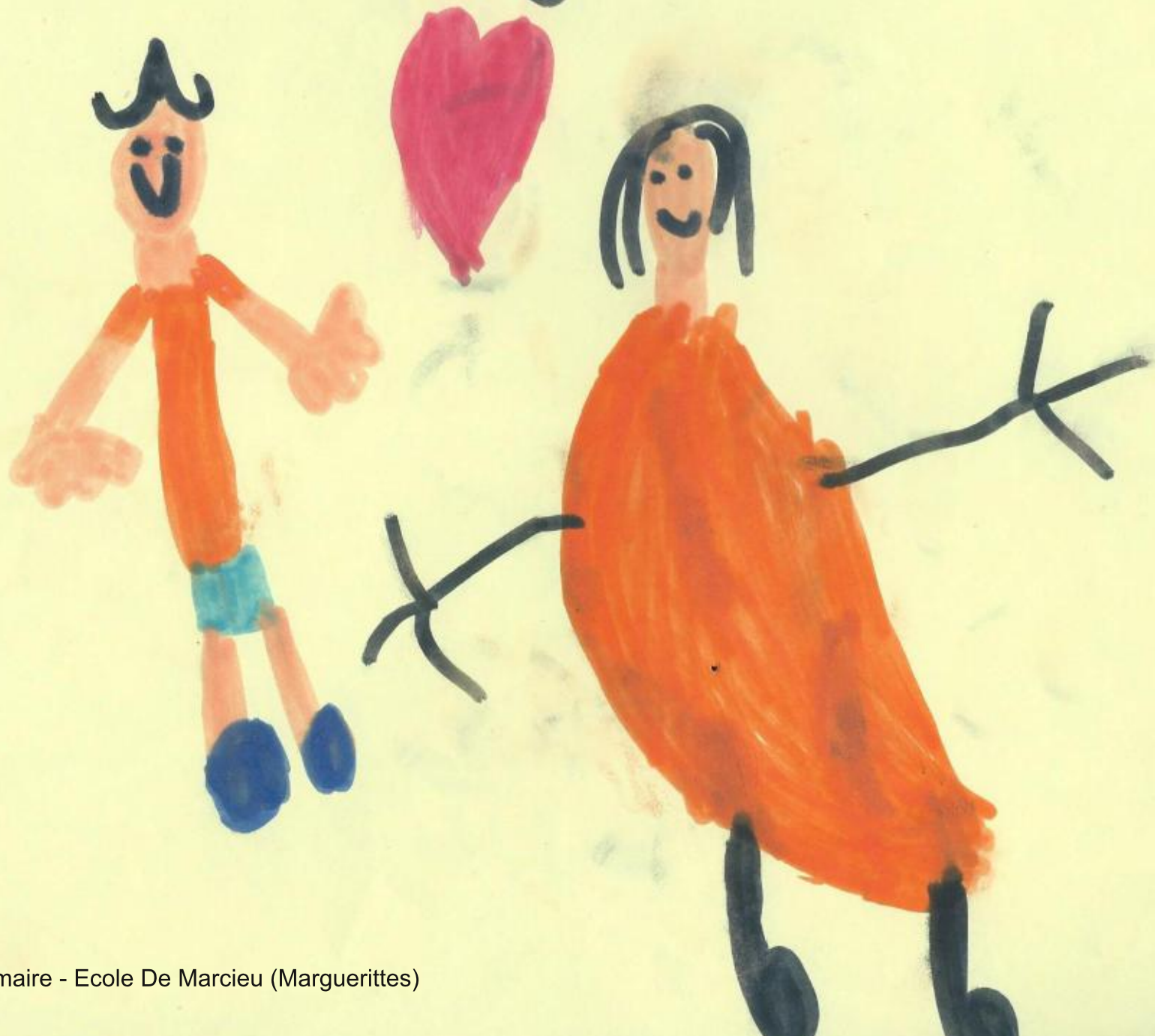
Les amoureux Dessins du récoltage en primaire - Ecole De Marcieu (Marguerittes)